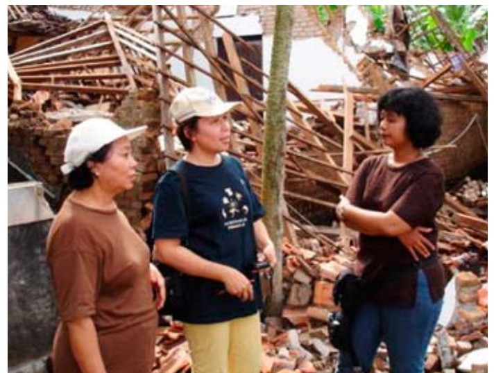
L'équipe de SD Indonésie évalue les dommages causés par le séisme de Jogjakarta.

développée pour l'établissement des capacités, et une capacité renforcée à coordonner le financement des projets.