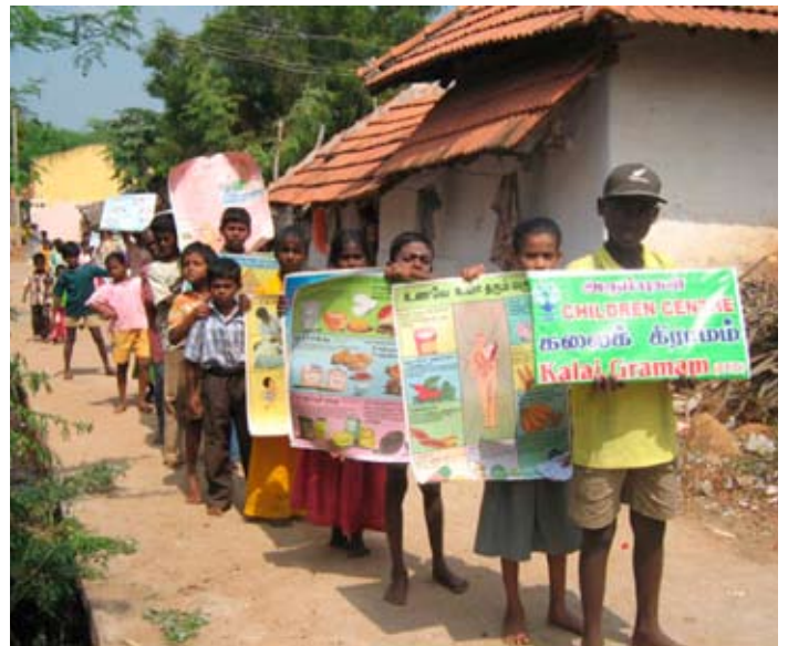
Programme d'Education Sanitaire au Centre pour la Culture et le Développement, Madurai, Inde.

Canada – SD Canada Indonésie – SD Indonésie, YUM/IRDN USA – Clear Path International (Pakistan), SD USA