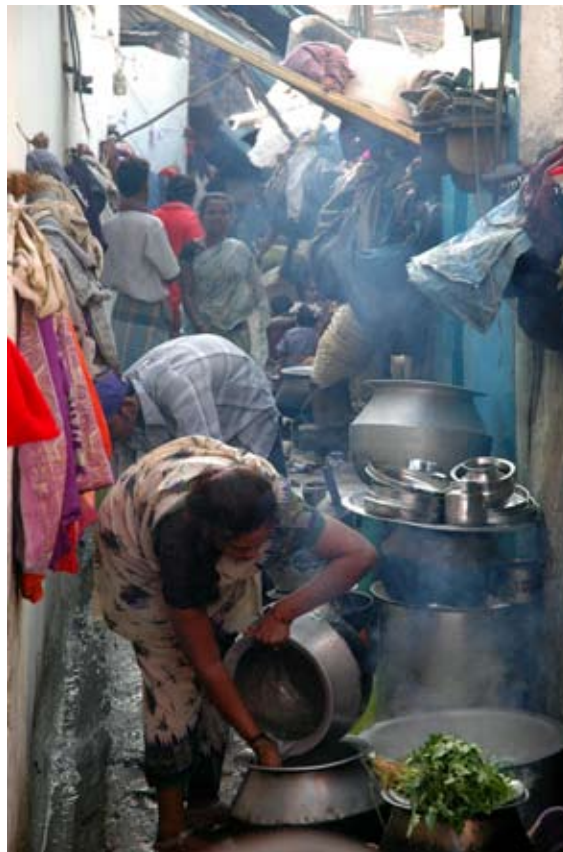
Communauté du Chemin de Fer à Bangalore, Inde, emplacement du Projet Anisha.

Une importante expérience pour nombre des participants à la réunion régionale d'Asie à Bangalore en Inde a été les visites sur site que les membres ont pu faire aux projets: la Fondation