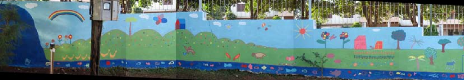
Peinture murale par des enfants au Jardin de Paix de l'Enfant, Brésil.