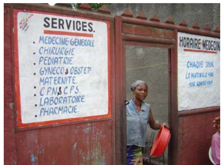
Clinique Maternité de Yengé à Kinshasa, R.D. du Congo.

Par le statut de SDIA d'organisation non-gouvernementale internationale (INGO) de Statut Consultatif auprès des Na-