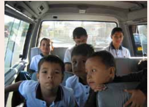
A new bus for the children at Fundacion Amanecer, Colombia.