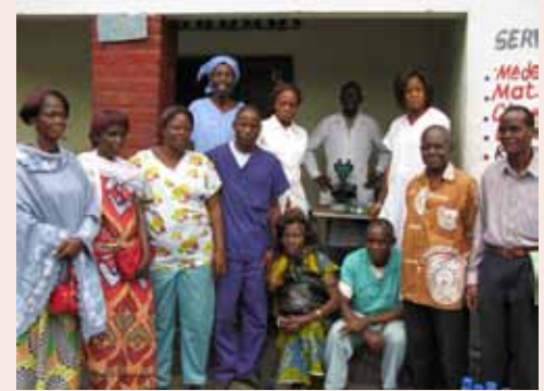
The staff of Yenge Health Center in D.R. Congo serve a wide community.

Los esfuerzos fusionados de la SDIA y de las organizaciones nacionales de SD, ayudaron a satisfacer las necesidades de más o menos 15 iniciativas sociales y humanitarias en el 2009: programas tales como La Escuela