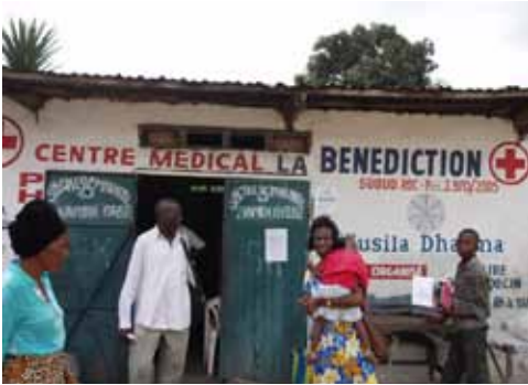
Lemba Imbu Clinic will pilot the community health center model in 2010.