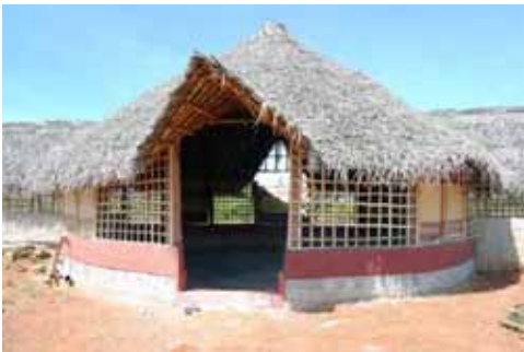
The Centre for Culture and Development, Madurai, India.