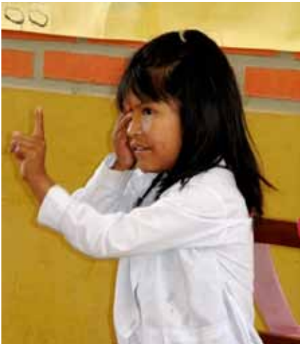
« Children's Vision » fournit des lunettes pour des enfants en Bolivie.