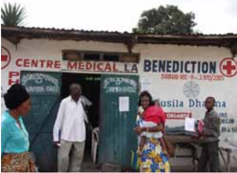
La clinique de Lemba-Imbu pilotera le centre de santé communautaire modèle en 2010