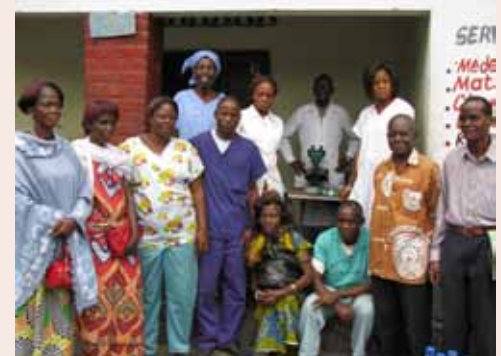
Le personnel du Centre de Santé Yenge en R.D. Congo dessert une communauté étendue.