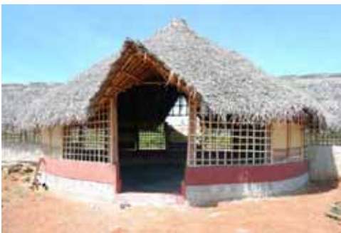
Centre pour la culture et le développement, Madurai, Inde