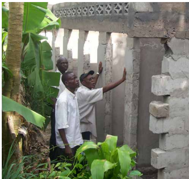
Construyendo el nuevo Centro de Salud Comunitario en Lemba Imbu, RD Congo.