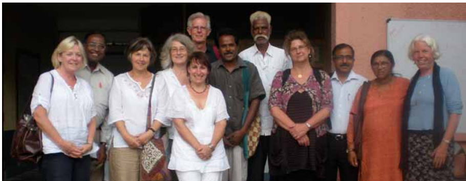
SD Gran Bretaña, SD Alemania, SD Noruega, SD USA y SDIA formaron la delegación que recorrieron proyectos en India.

SDIA comenzó la tarea de desarrollar una Guía de Valoración de Capacidades para orientar los esfuerzos de evaluar las fortalezas y debilidades organizacionales de los Proyectos SD y para proporcionar ayuda necesaria.