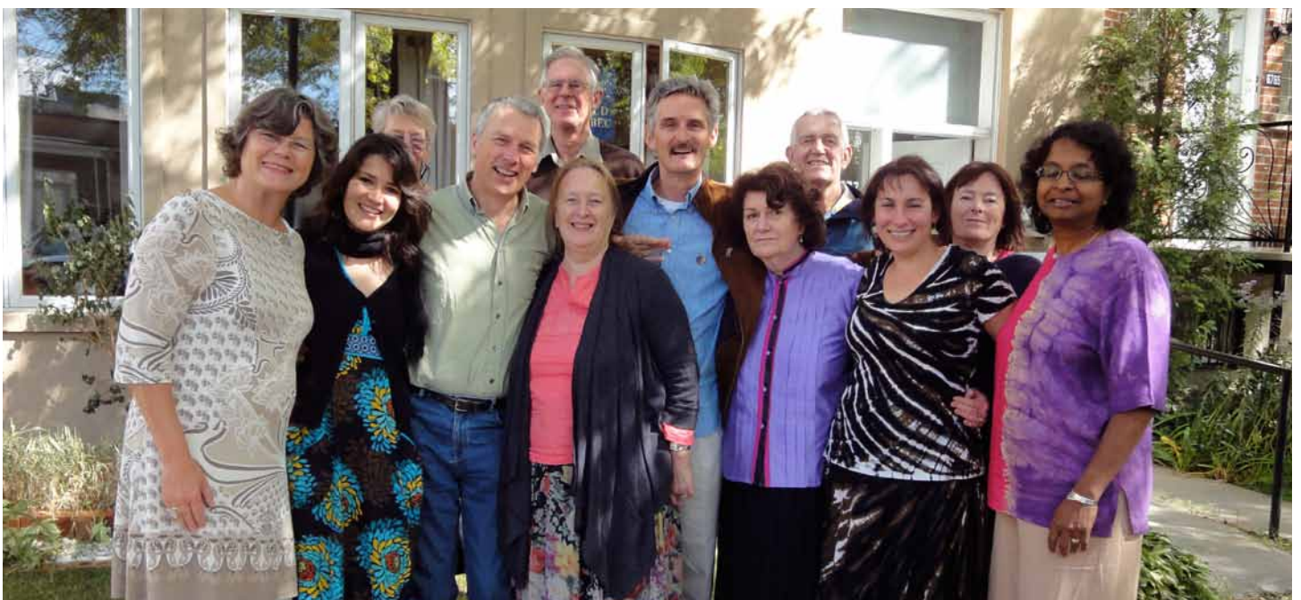
El Consejo Directivo de SDIA y observadores se reunieron en Montreal, Canadá en setiembre.