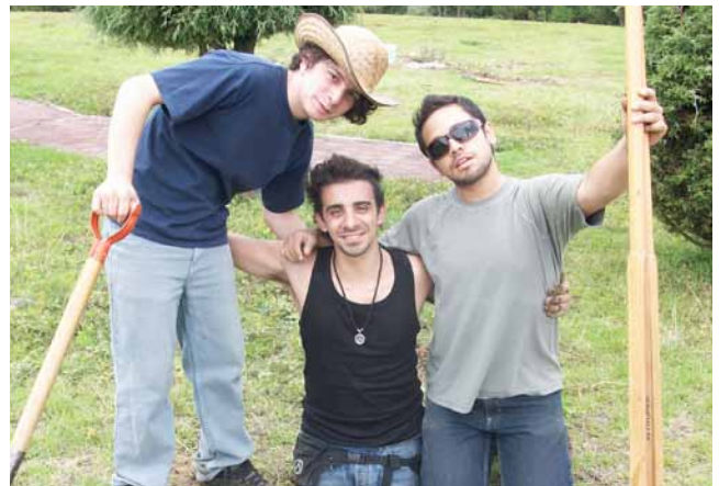
Voluntarios al Campamento de la Fuerza Humana en México

Campamento de Voluntariado Fuerza Humana, México: Los jóvenes son cada vez más activos y comprometidos en llevar los proyectos SD al éxito y contribuir al desarrollo de sus comunidades. El segundo campamento de Voluntarios Fuerza Humana se celebró en julio de 2010, gracias al apoyo recibido de la Fundación Guer-