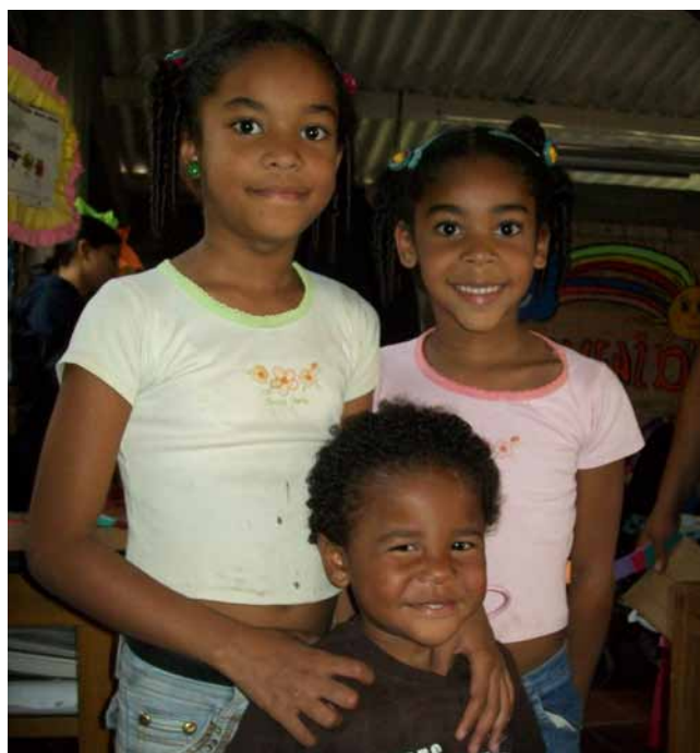
Un beneficiario del programa de Primera Infancia de la Fundación Amanecer en el municipio de Pijao con sus hermanas mayores.