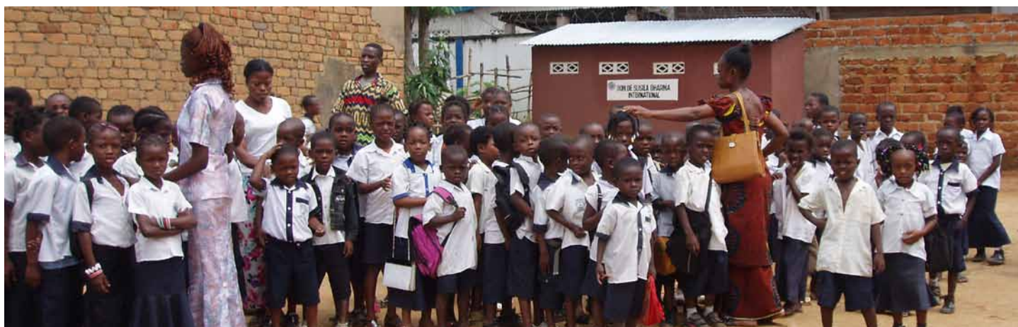
Estudiantes y profesores del Complejo Escolar SD de Inkisi, RD de Congo.