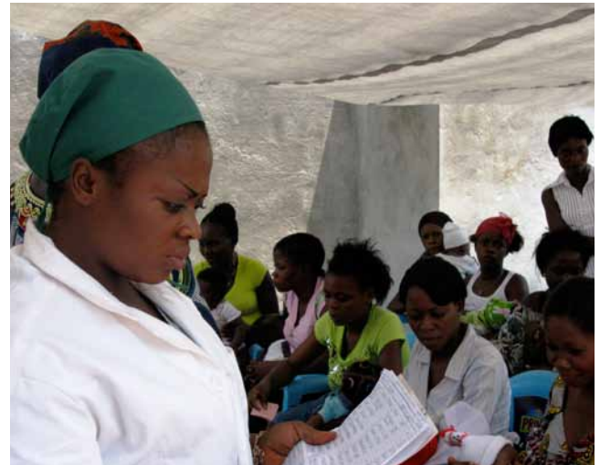
Madres y bebés reciben cuidados postnatales en la Policlínica de Yenge, Kinshasa.

Un nuevo centro de salud comunitario en Lemba Imbu, RD del Congo: Con el apoyo de la Fundación Muhammad Subuh (MSF), SD Canadá, SD Francia, SD Gran Bretaña, SD Irlanda, SD países bajos, SD Noruega y muchos donantes, SDIA completó las necesidades financieras de la Fase 1 de su colaboración con Médicos de África (Médecins d'Afrique) para desarrollar un centro de salud, propiedad de y operado por la comunidad (CSCOM) en el distrito Ndjili Kilambu. El CSCOM proveerá cuidados primarios en salud a 17,000 habitantes de área local, quienes corrientemente tienen poco acceso a cuidados de la salud de calidad y que puedan pagar.