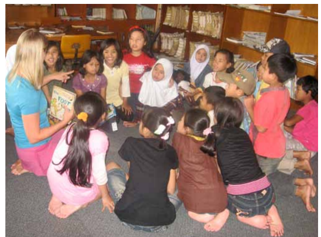
Una charla a la biblioteca de la aldea Cipanas de YUM.

YUM Proyecto Cipanas, Indonesia: Desde la evaluación del 2007 de la aldea de los chicos, apoyada por el Blond Trust y SDIA, el proyecto ha estado pasando transformaciones. Desde ser una residencia para los huérfanos y pobres ha pasado a ser hoy un centro comunitario enfocado en el apoyo de niños y jóvenes sin privilegios y sus familias. Actualmente, la aldea YUM tiene 300 niños y jóvenes en su Centro de Formación Vocacional, aprendiendo inglés, ciencias de la computación, confección y otras habilidades comerciales. Hay 150 niños al mes quienes se benefician de educación remedial y suplementaria además de actividades culturales y creativas extra-curriculares. Hay también 70 participantes en un programa preescolar