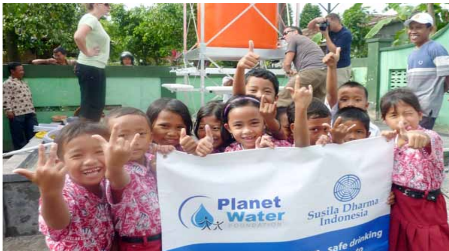
Niños campesinos en Indonesia apreciaron el agua limpia provista por SD Indonesia y Planet Water (USA) tras la erupción del volcán Merapi.

Nota: el déficit sin restricciones aparente se debe a la transferencia del Fondo de Reservas al Fondo de Dotación. Sin eso habría un surplus sin restricciones de $33.726