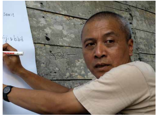
YTS trabaja con campesinos para crear planes de desarrollo apropiados. Kalimantan, Indonesia.

El presente informe les rinde cuenta a los miembros, donantes, amigos y público en general sobre las actividades del Consejo Administrativo y de la oficina de SDIA en línea con los objetivos establecidos y los medios financieros a su disposición.