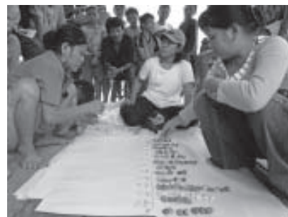
PRA Planifications Communautaire Projet, YTS, Kalimantan