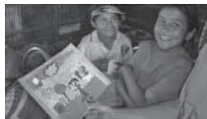
My Neighborhood (Mon Voisinage), USA