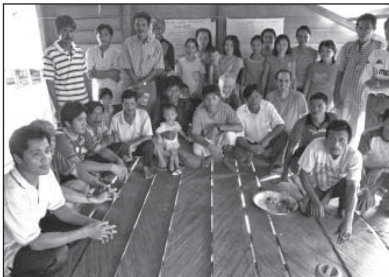
Le Yayasan Tambuhak Sinta soutient le développement des villages à Kalimantan, Indonésie.

Ce rapport annuel couvre les activités 2007 du bureau international de SDIA dans leur service à nos membres. Il ne couvre pas les activités et les accomplissements de tous nos 66 membres. Les rapports annuels 2007 des membres du réseau sont disponibles à http://susiladharm.org .