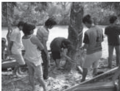
Apprentissage de la culture d'hévéas YTS, Kalimantan