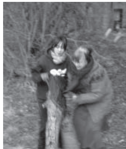
Une réunion de travail de bénévoles SD Grande-Bretagne