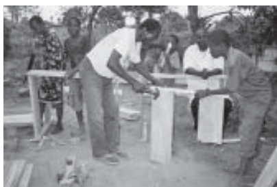
Construction de l'école Albadi DR Congo

Les projets de Susila Dharma sont des initiatives locales et leurs activités touchent quatre grands domaines du développement. Certains projets agissent dans plusieurs domaines d'activité et, afin d'éviter les redites, sont listés ici en fonction de leur activité principale et de leur zone géographique.