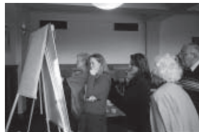
Réunion de travail en réseau à Lewes, UK, Janvier, 2007

Europe : Sun For Life (active à Madagascar).