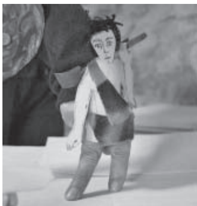
Cain tue Abel Marionnettistes Sans Frontières, France