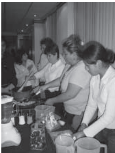
Programme de nutrition de l'Asociación Vivir, Ecuador