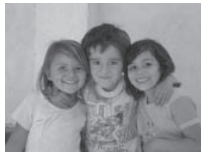
Trois amis, Comunidad las Calles, Argentina

Les organisations Susila Dharma nationales agissent ensemble pour soutenir les projets par des partenariats et pour promouvoir une conscience mondiale dans leurs pays. Elles sont actives dans les pays suivants : Allemagne, Argentine, Australie, Canada, Chili, Colombie, Cuba, Espagne, France, Grande-Bretagne, Hollande, Inde, Indonésie, Irlande, Norvège, Nouvelle-Zélande, Portugal, RD du Congo, Serbie, Surinam, Ukraine et USA.