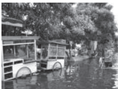
Les inondations de Jakarta, Février 2007