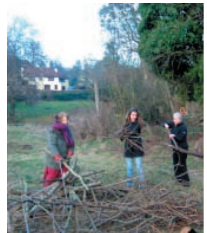
Une réunion de travail de bénévoles SD Grande-Bretagne