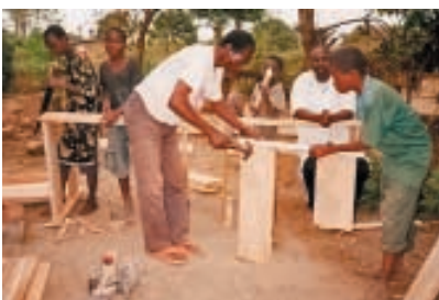
Construction de l'école Albadi DR Congo

Les projets de Susila Dharma sont des initiatives locales et leurs activités touchent quatre grands domaines du développement. Certains projets agissent dans plusieurs domaines d'activité et, afin d'éviter les redites, sont listés ici en fonction de leur activité principale et de leur zone géographique.