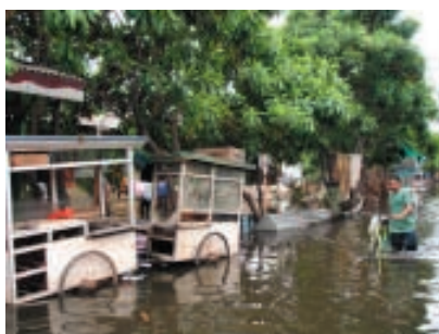
Les inondations de Jakarta, Février 2007