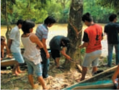
Apprentissage de la culture d'hévéas YTS, Kalimantan