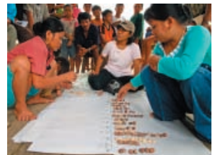
PRA Planifications Communautaire Projet, YTS, Kalimantan