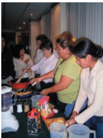
Programme de nutrition de l'Asociación Vivir, Ecuador