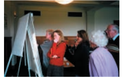
Réunion de travail en réseau à Lewes, UK, Janvier, 2007

Europe : Sun For Life (active à Madagascar).