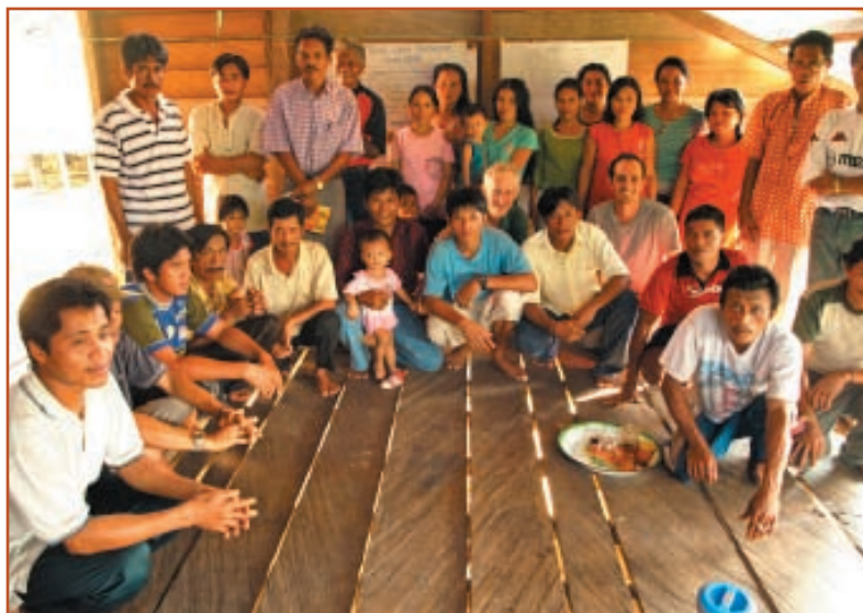
Le Yayasan Tambuhak Sinta soutient le développement des villages à Kalimantan, Indonésie.

L'association a été créée en 1969 et est une organisation affiliée de l'Association Subud mondiale. Susila Dharma International est une organisation sans but lucratif enregistrée aux USA, et qui est dotée du statut consultatif spécial auprès du Conseil économique et social des Nations Unies (ECOSOC), de l'UNICEF et du Département de l'information publique (DPI). Numéro fiscal pour dons (USA) : 98-0156249.