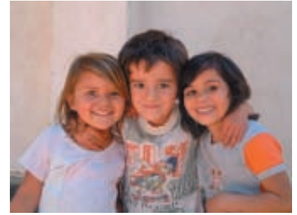
Tres amigos, Comunidad las Calles, Argentina

Internacional (español)— nuestro principal método de compartir información acerca de las actividades de la red- se produce mensualmente. En 2007 fueron distribuidos trece boletines en inglés y en español.