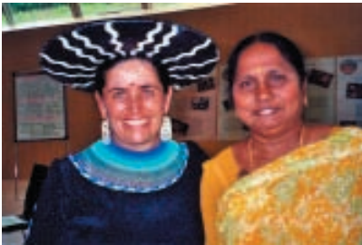
Uraida, Inka Samana, Ecuador & Fundación Bella, Mithra, India