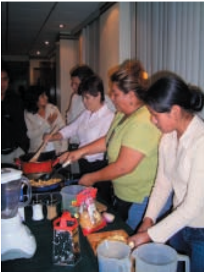
Programa nutricional Asociación Vivir, Ecuador