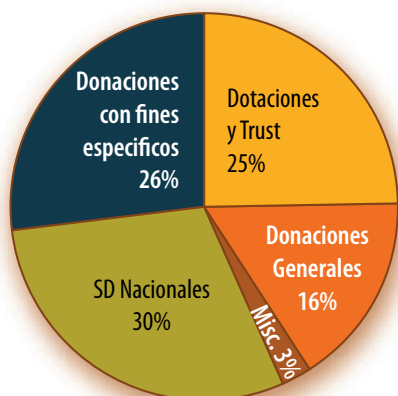
INGRESOS DE LA SDIA 2007 (TOTAL $200,013)