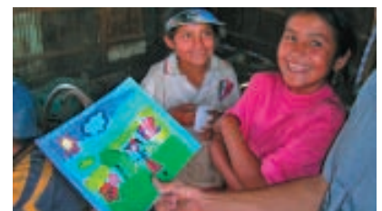
My Neighborhood (Mi vecindario), Estados Unidos