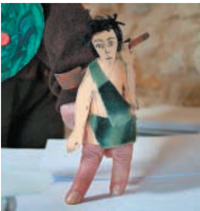
"Cain slays Abel" (Caín mata a Abel), Titiriteros sin Fronteras, Francia